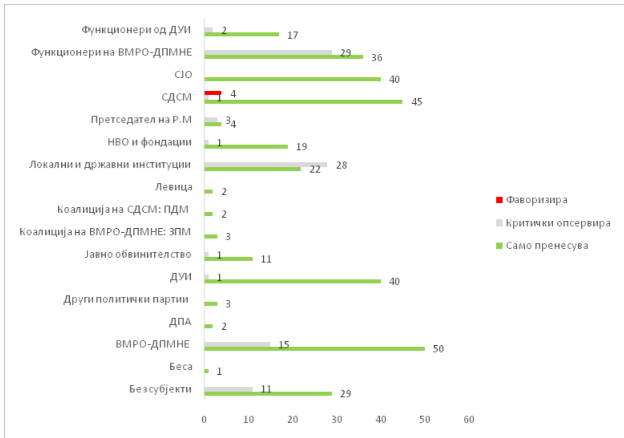
Приод во известувањето кон политичките субјекти на телевизијата 24 Вести (16-20 и 23-27 јануари)

Постапките на функционерите од оваа партија беа почесто цел на критичка опсервација, и тоа министерот за здравство Никола Тодоров во врска со цената, локацијата и други спорни аспекти на проектот за нов клинички центар (20 јануари: „Техничка влада не смее да прави грандиозни проекти. Клинички го следат контроверзи. Тодоров не отстапува“), градоначалникот на Скопје Коце Трајановски за